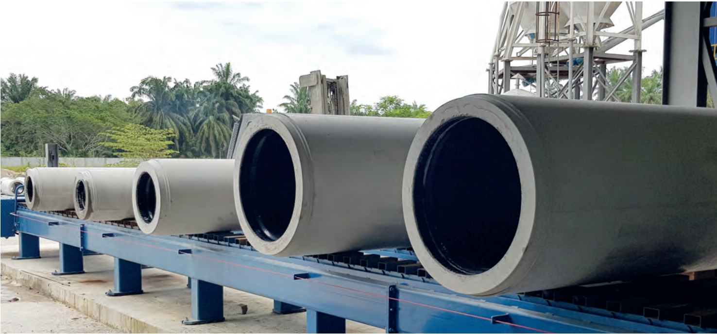
В настоящее время компания Bilcon Industries производит трубы Perfect Jacking Pipe номинальным внутренним диаметром до 900 мм

пании Bilcon Industries Стефан Тан Энг Хое: «Технологическая система Perfect Pipe идеальным образом сочетает в себе высокие стандарты качества продукции, производительность и простоту обслуживания».