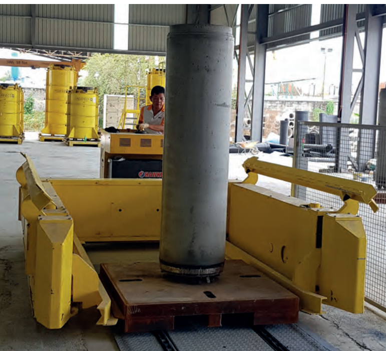
Транспортировка при помощи электропогрузчика

Компания Bilcon Industries высоко ценит инновационные бетонные технологии. Поэтому не удивительно, что в первые два года существования производства труб Perfect Pipe бетонные рецептуры и технологические процессы непрерывно совершенствовались. Теперь нормой стало ежедневное многократное использование формооснастки. Этому в немалой степени способствовала автоматическая производственная линия компании Schlüsselbauer. Технология, когда распалубка изделий осуществляется после отверждения, ныне достигла такой производительности, о которой еще несколько лет назад нельзя было и мечтать. Об этом говорит и управляющий директор ком-