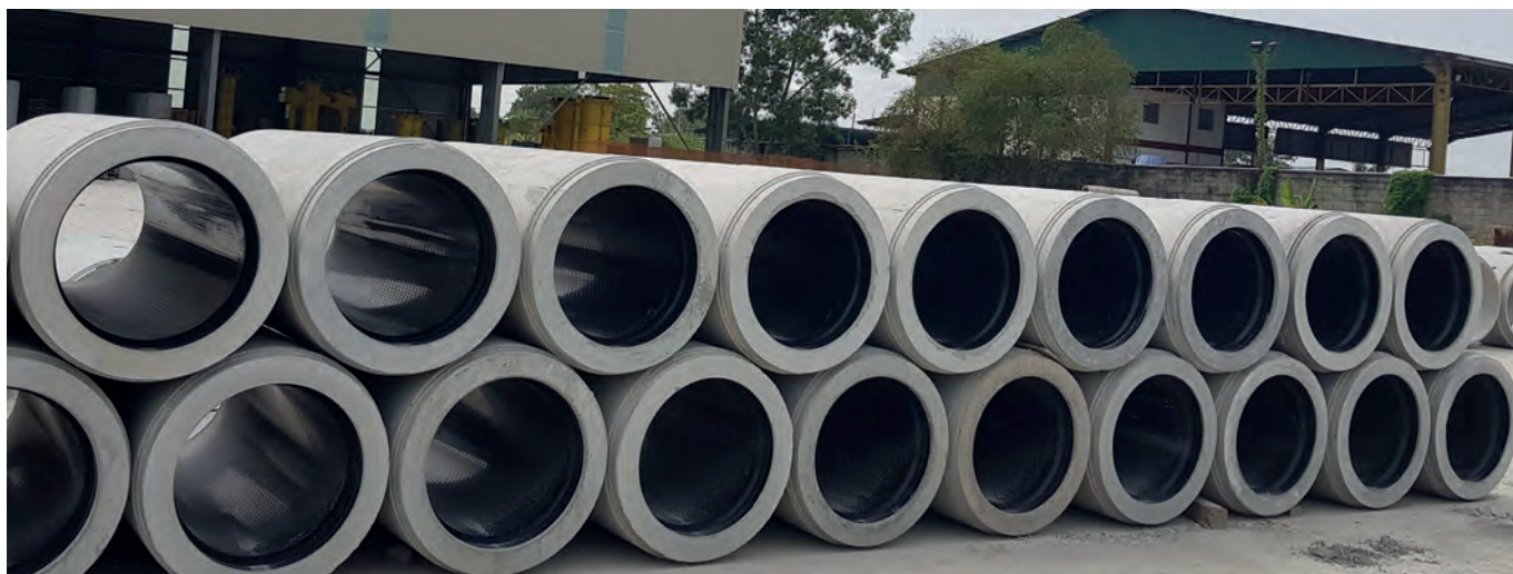
Труба модели Perfect Jacking Pipe на складе компании Bilcon Industries

Поэтому в Сингапуре трубы, предназначенные для инфраструктурных объектов, должны обладать не только долговечным антикоррозионным покрытием и соответствующей долговечностью, но и достаточной механической прочностью, чтобы не разрушиться на этапе их прокладки на стройплощадке. Особенно это требование касается труб, номинальный диаметр которых не позволяет осуществлять к ним доступ после их установки, поскольку устранить дефекты на таких участках значительно сложнее, чем в трубах, доступных для рабочих-ремонтников, а иногда и вовсе невозможно, - в этом случае требуется замена всего участка. Новая труба компании Bilcon Industries в полной степени соответствует требованиям проектировщиков, муниципальных и частных заказчиков и подрядчиков. Положительный опыт использова-