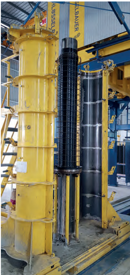
Сердечник формы с установленным вкладышем и арматурным каркасом в сборе

ным покрытием, а также бетонным трубам с вкладышем ПЭВП, в отличие от синтетических труб. Компания Schlüsselbauer предлагает технологию для изготовления бетонных труб и элементов с диаметром условного прохода от