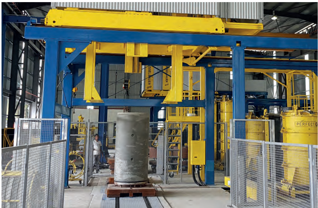
Распалубка трубы после набора прочности

250 до 1200 мм с антикоррозионным вкладышем Perfect Liner и синтетическим соединительным переходником, называемым также Perfect Connector.