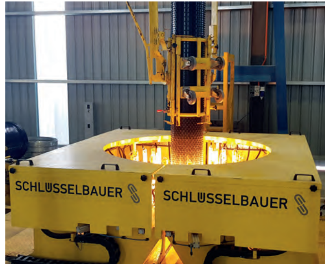
Термопластическим методом формируются раструбы

ния труб марки Bilcon Perfect Pipe позволяет сделать вывод о том, что в будущем в Сингапуре и Малайзии еще на этапе проектирования предпочтение будет отдано крупноформатным трубам со сплошным антикоррозион-