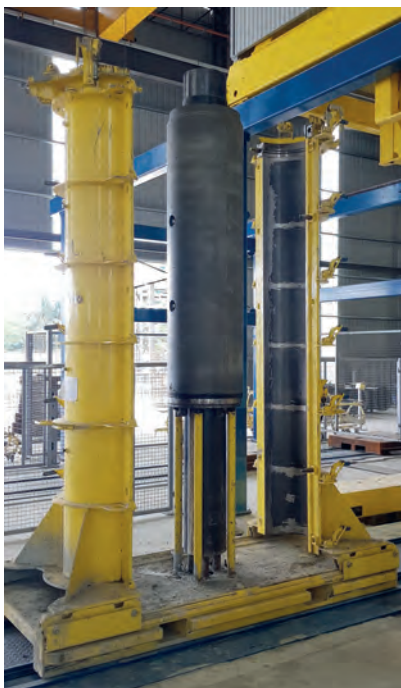
Отвердевшая труба Perfect Jacking Pipe