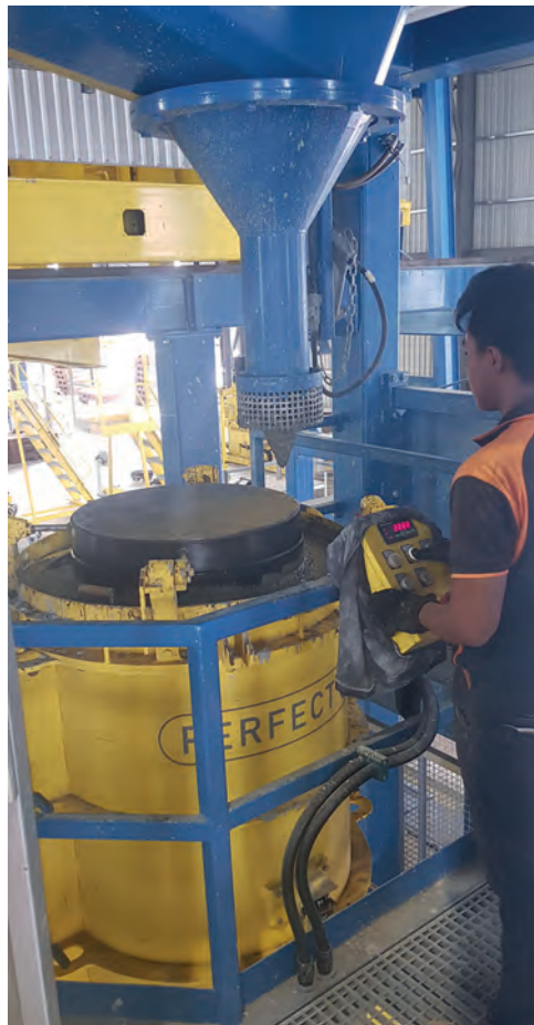
Загрузка самоуплотняющегося бетона в форму