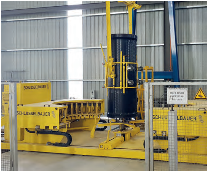
Цилиндр-сердечник при помощи крана и вспомогательной конструкции передается на формовочный пост